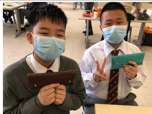
中一團隊挑戰訓練