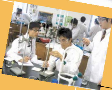
多元智能訓練營 培養積極人生觀