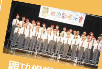
觀功悠揚樂韻聲 鏗鏘悅耳歌藝精