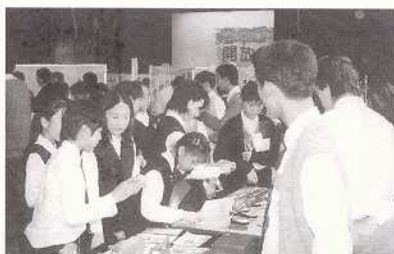
禮堂內一片熱鬧氣氛

不斷學習、不斷吸收、不斷進步，是終身學習的要旨，現今資訊一日千里，我們不可以原地踏步，而今年開放日的展品正好鼓舞我們敢於學習、敢於嘗試、敢於創新，真的令我們獲益良多呢！