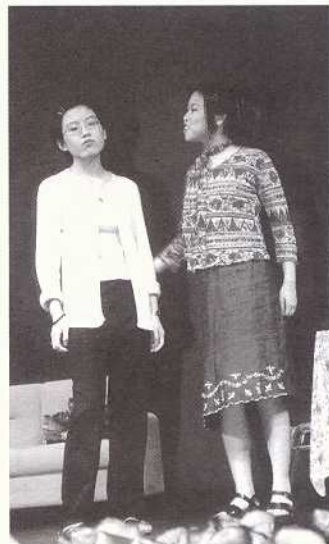
戲劇表演—微笑的風波

表演中段是音樂的世界，去年由教育署優質教育基金撥款所開辦的管弦樂團，在那天終有了成