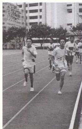
並駕齊驅，看誰奪標。

十一月二十二日及十一月二十六日，秋高氣爽，學校舉行三十周年陸運會，場面隆重，同學們唱完莊嚴的校歌後，陸運會於同學的掌聲中正式開始。