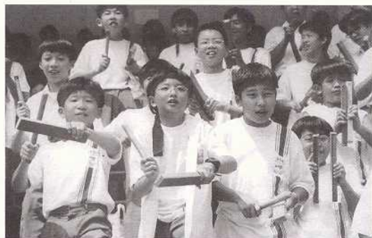
啦啦隊努力為健兒打氣

夕陽在山，最後一場比賽完畢了，得獎的同學都已於頒獎典禮上獲得精美的獎牌，各同學只好帶著依依不捨的心情，期待著明年陸運會的來臨。