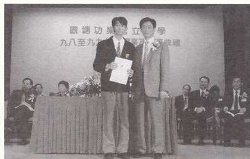
主禮嘉賓—教育署高級助理教育署長應耀康先生頒發予獲獎學生

今天的畢業典禮，對我們這群中五學生來說，有雙重意義，除了是一個榮譽外，還暗示來年的畢業典禮，我們會以另一個身分出席——本校生、外校生、就業人士？臺上的畢業生，是我們的鏡子，來年便輪到我們上臺了，我們必須努力爭取佳績，希望來年我們可以用觀功中六學生的身分出席這個畢業典禮吧！