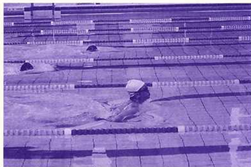
一浮一沉，成蛙成蝶，錦標在望