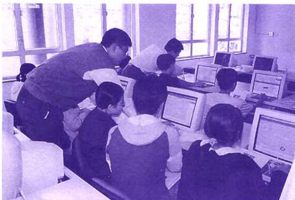
在數控設計工場進行動畫培訓，與友校分享資源