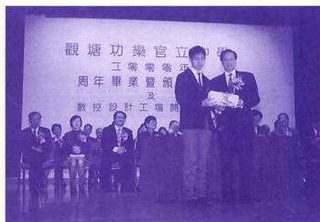
主禮嘉賓——香港理工大學潘宗光教授頒授文憑予畢業生代表