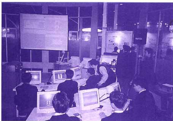
在資訊科技博覽2001的IT教室作示範