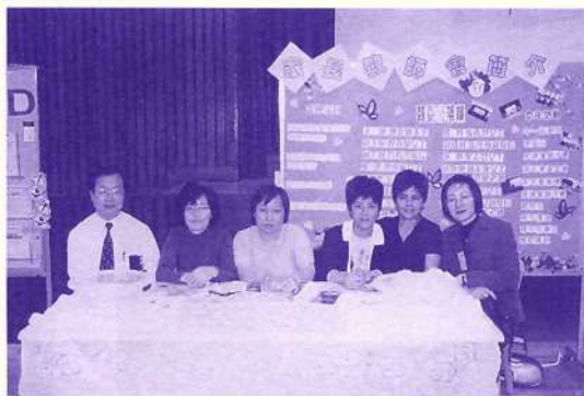
家長教師會設展板介紹該會