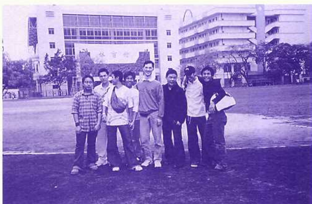
廣州第六中學的校園多寬敞啊！

肅然起敬，最後雖然感到有點捨不得，但還得要離開。 第二天，我們主要參觀一些古蹟名勝，看到南越王的陵墓，給我一種宏偉壯觀的感覺，導遊的詳盡介紹，使我更了解南越的傳統文化，獲益良多。遊覽中山紀念堂時，看到紀念堂頂層沒有柱而能支撐，更有機會看到寫上國父遺訓的碑文。然後便到黃花崗七十二烈士公園，在那七十二烈士的墓碑前，我頓時