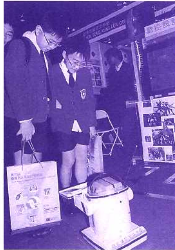
多麼先進的科技產品

為了迎接廿一世紀科技教育新時代的來臨，本校設計與科技科推出一個新的教學計劃——「創意設計，明日科技」。該計劃獲優質教學基金贊助港幣約二百二十萬推行，主要是透過現代化的「數控設計工場」和「視像會議」的設施，引領教師及學生利用電腦的輔助，將學生設計的每一個環節準確、具體而細緻地呈現出來；同時，又透過電腦數控機床，將他們的設計即時實踐製作；使學生能夠迅速地享受設計的成果。電腦輔助設計及數控機床的模擬製作，使到設計與科技的學習，拋離了傳統學徒的手作模式，不但緊貼今天社會上的科技發展，亦大大提高了學生的學習興趣，使到學生的創意能夠盡情發揮。