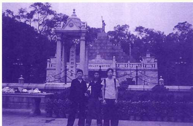
在黃花崗七十二烈士公園憑弔革命先烈