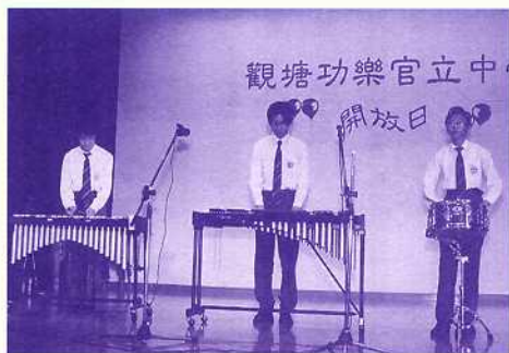
敲擊小組敲出愉快的校園生活節奏