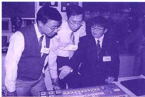
在優質教育基金匯演上，同學細心地向嘉賓介紹