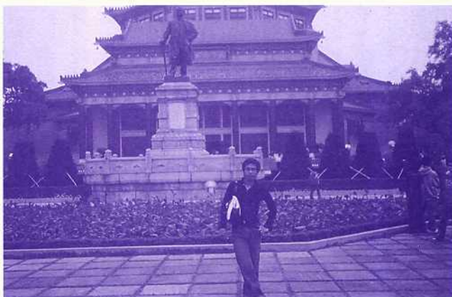
中山紀念堂前留影